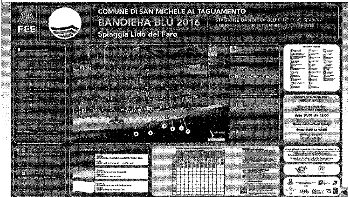
Esempio di pannello informativo spiaggia

Questo è solo un esempio. Per scaricare il pannello da personalizzare andare al link https://drive.google.com/folderview?id=0B7mjip_gA_6LS0YyTzFZOERDSUE&usp=sharing